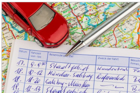
Das klassische Fahrtenbuch gehört der Vergangenheit an.