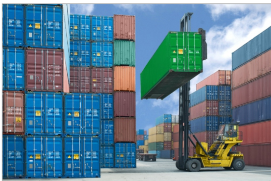
Container-Standorte mit GPS immer bekannt