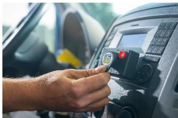
Stempeln direkt im Fahrzeug über RFID Chip.

Über die Schnittstelle werden zusätzlich Positionsdaten von Beacons übergeben und direkt auf der Karte in DATAflor angezeigt.